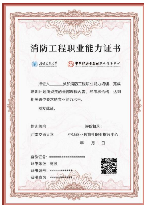
消防工程能力认证高级证书样式