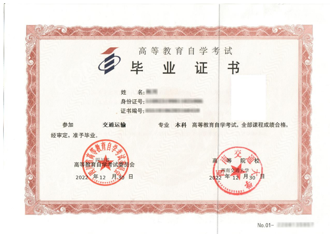
高等教育自学考试毕业证书（样张）