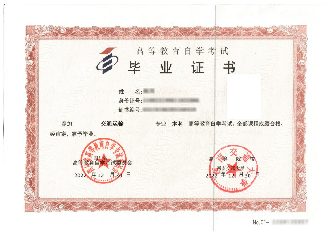
高等教育自学考试毕业证书（样张）