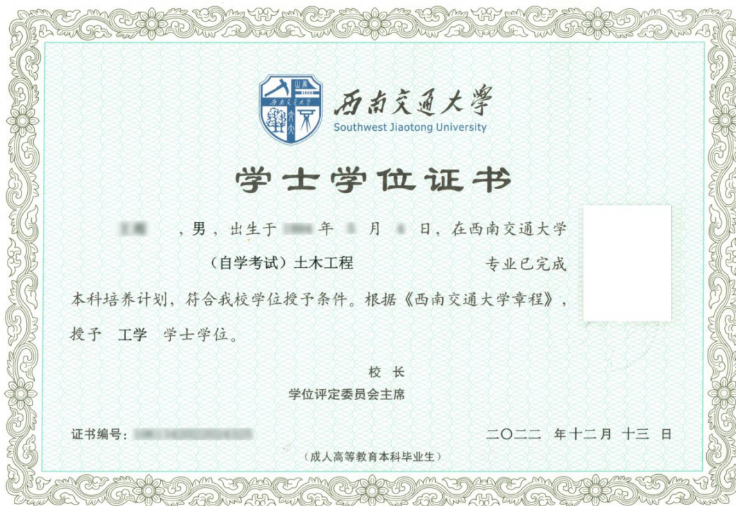
学士学位证书（样张）